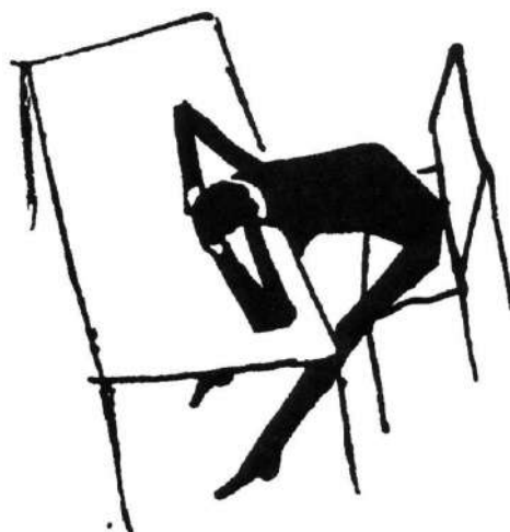
dessin de Franz Kafka

La rencontre de l'écrivain et de la petite fille est vraie : elle est mentionnée par Dora Diamant, l'amoureuse de Franz Kafka, dans ses mémoires. Les aventures de la poupée sont évidemment inventées. C'est le fruit de l'imagination de l'écrivain. Ce dernier utilise la fiction pour voler au secours du chagrin de la petite fille et lui faire oublier sa peine, faire le deuil de la perte de l'objet aimé, la poupée disparue. Ce n'est donc pas vrai, c'est inventé. Est-ce pour autant un mensonge ? C'est l'occasion d'aborder une petite discussion philosophique sur mentir et inventer.